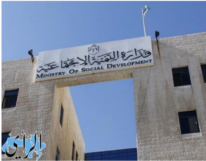
تنقلات في وزارة التنمية الاجتماعية